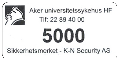
Eksempel på et ToolMark skilt